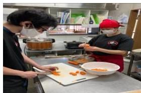
山昇:野菜カット作業