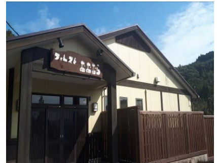
フォレストおおむらの外観写真