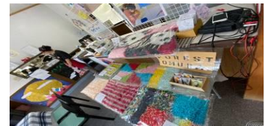
手芸製品(ラグ、マットなど)