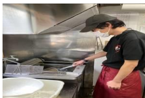
山昇:フライヤー作業

就労継続支援B型では、唐揚処山昇(飲食店)にて厨房作業や接客作業などを行っています。生活介護においても作業活動(シール貼り作業や手芸品作製など)に取り組んでいます。このほか、カラオケやスポーツ、茶話会(フリートークや勉強会など)なども行っています。