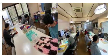
手芸製品作成風景